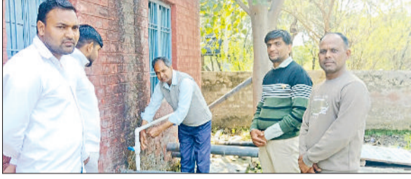
नारनौल। जल अर्पण दिवस जल श्रोतों को धागा बांधकर ग्रामीण पंचायत को अर्पित करते हुए विभाग के अधिकारी साथ में ग्राम सरपंच।