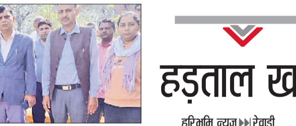
रेवाड़ी। ग्रामीणों को जागरूक करते हुए पुलिस टीम।

योजनाओं की प्रगति की समीक्षा की। बैठक में जलभराव, सोलर एनर्जी के प्रसार, पानी की निकासी, गांवों के विकास, शहरों में आम जनसुविधाएं, पशुपालन व डेयरी व्यवसाय, नहरी पानी का प्रबंधन, वन संरक्षण, चिकित्सा सेवाएं, ग्रामीण व शहरी क्षेत्र में उद्योगों की