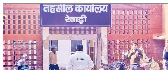
रेवाड़ी। गद्दी बोलीनी रोड स्थित तहसील।

प्रदेश भर के तहसीलदारों ने डीआरओ और एसडीएम को रजिस्ट्रियों की कमान सौंपने के