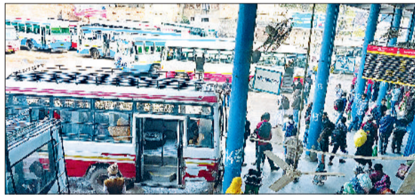
रेवाड़ी। बस स्टैंड परिसर में आज दो घंटे रहेगा प्रदर्शन। तथा हड़ताल को लेकर बैठक करते हरियाणा रोडवेज वर्कर्स यूनियन के कर्मचारी।

एआईयूटीयूसी से संबंधित आशा कार्यकर्ता यूनियन, आंगनवाड़ी कार्यकर्ता एवं सहायिका यूनियन, मिड-डेमील कार्यकर्ता यूनियन व भवन निर्माण कारीगर मजदूर यूनियन ने नेताजी सुभाष पार्क में होगा विरोध प्रदर्शन